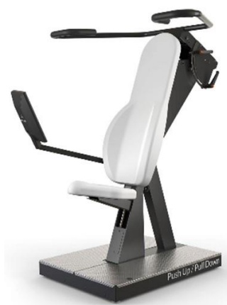
プッシュアップ/プルダウン